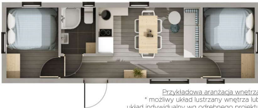
Przykładowa aranżacja wnętrza * możliwy układ lustrzany wnętrza lub układ indywidualny wg odrębnego projektu

Dom Meveline serii REVA to rozwiązanie zarówno dla klientów indywidualnych jak i kempingów, ośrodków czasowych oraz inwestorów czerpiących zyski z wynajmu. To wygodna alternatywa dla domów budowanych tradycyjną metodą, domków drewnianych, oraz tzw. domków holenderskich. Dom jest dostarczany na miejsce gotowy i zwykle posadawiany praktycznie na gruncie, bez fundamentów. Dzięki wyposażeniu w demontowane koła, może być ustawiony w niemal dowolnym miejscu. Po umieszczeniu na docelowym miejscu, możliwe jest skuteczne zamaskowanie funkcji mobilności i estetyczne wkomponowanie w otoczenie.